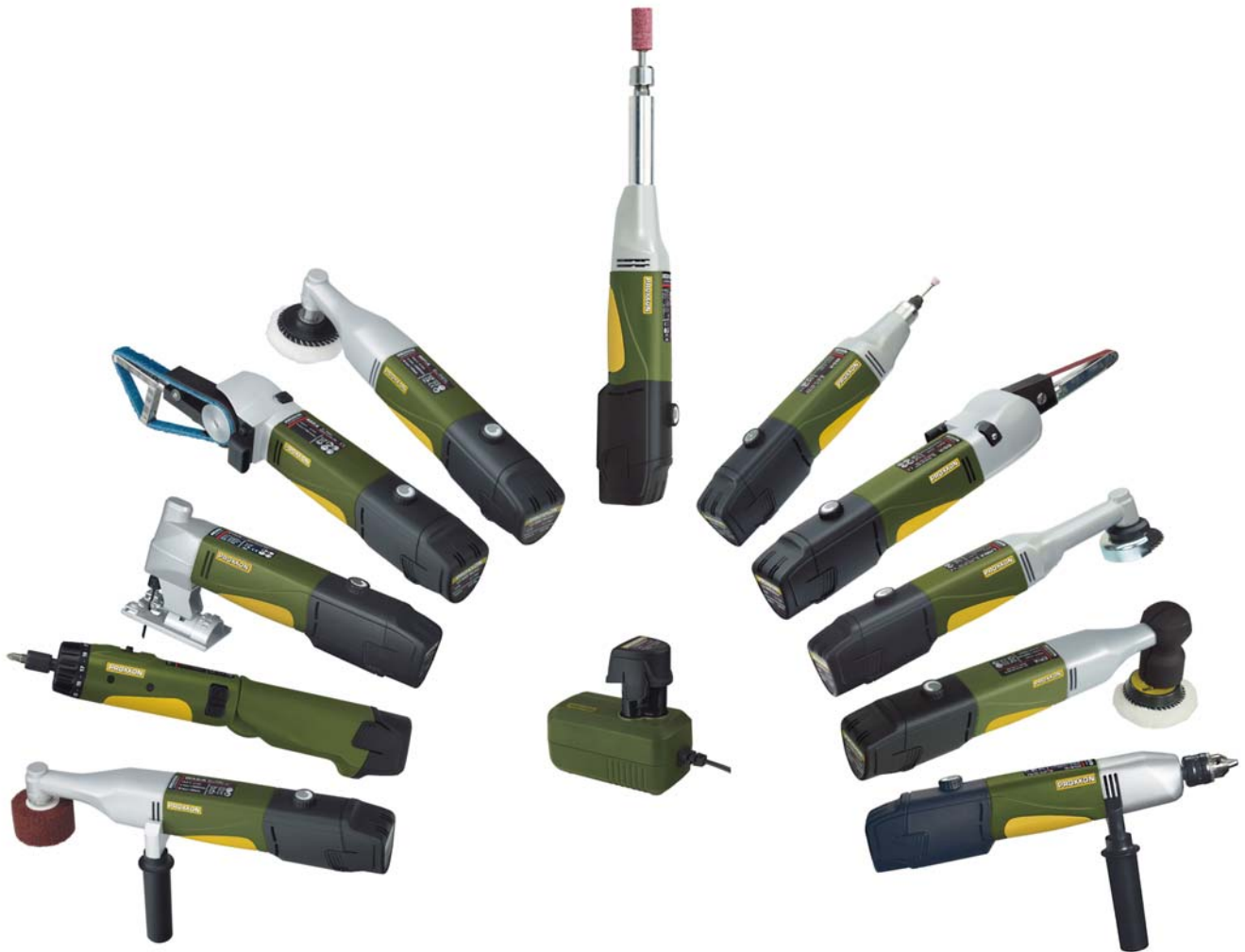
11 Geräte - ein System!